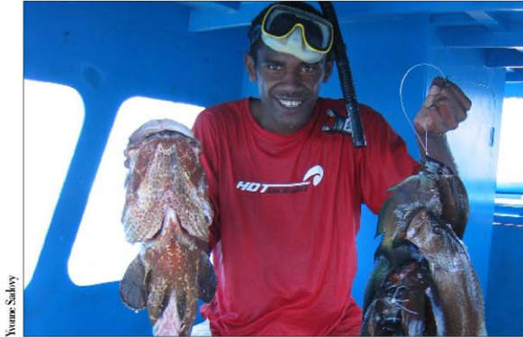
E sa dau qolivi sara vakalevu na ika ena nodra gauna ni vakasucu me vaka na kawakawa ka vakaraitaki tiko oqo. Na varagi ni qoli e dau vakayataki sara vakalevu me ra dau qolivi kina na ika oqo sai koya na dakai ni numu kei na veimataqli siwa tale eso.

Sa yaco liko e na so na vanua, ia e se lailai wale